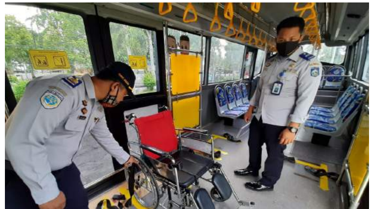
• Monitoring Bus Disabilitas oleh Dishub Provinsi NTB