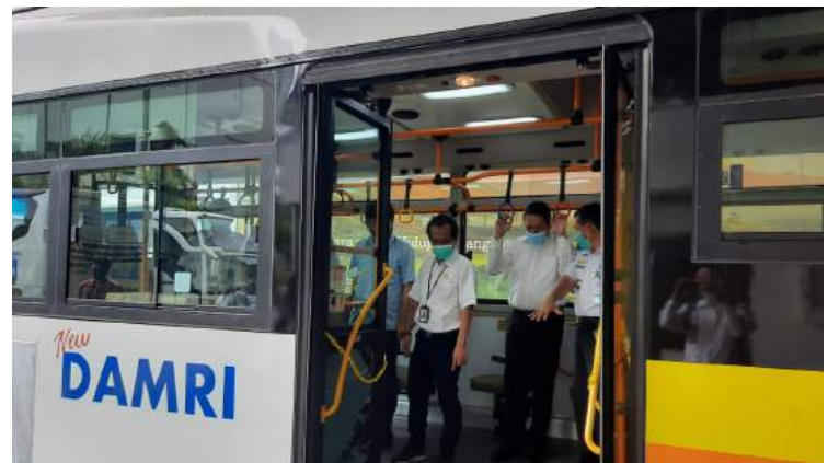
• Monitoring Bus Listrik, Dirkom dan BPTJ di Cabang Basoetta