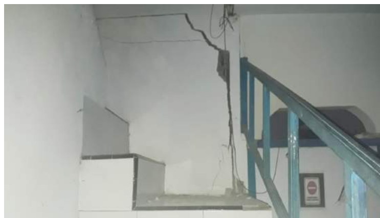
• Kondisi Kantor DAMRI Mamuju sesaat setelah gempa