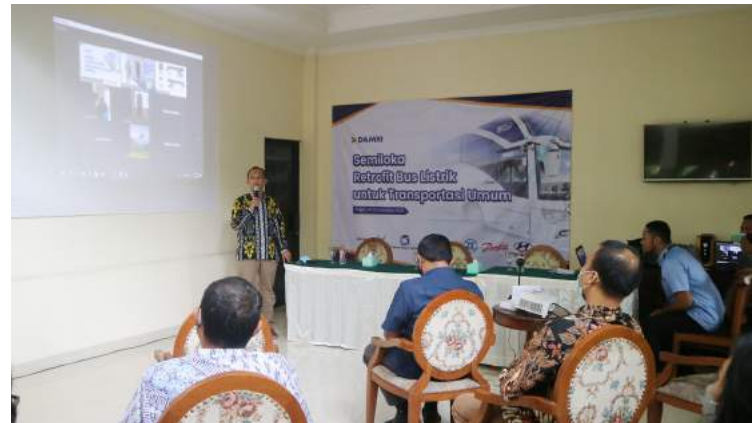
• Semiloka Retrofit Bus DAMRI dan Spora

DAMRI juga berencana untuk membuka program retrofit ini bagi operator transportasi darat lainnya, baik pihak swasta, pemerintah daerah, maupun instansi pemerintah yang berminat. Dalam program retrofit ini, DAMRI bekerja sama dengan beberapa partner penyedia teknologi, baik dari pihak swasta maupun dengan BUMN lain yang berkompeten di bidangnya.