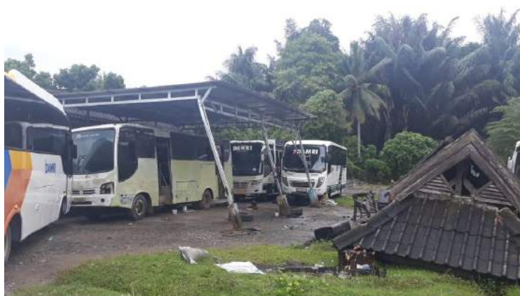
• Kondisi Pool DAMRI Mamuju sesaat setelah gempa

Semoga seluruh penyintas gempa tetap kuat. Semoga kita semua tetap dalam lindungan Tuhan Yang Maha Esa.