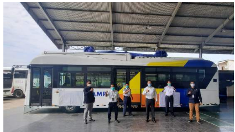
• Monitoring Bus Listrik, Dirkom dan BPTJ di Cabang Basoetta