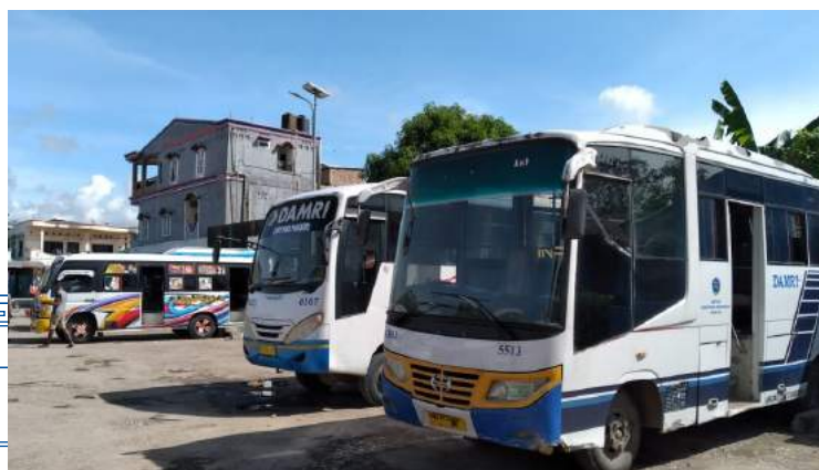
• Lokasi: Cabang Kefamenanu