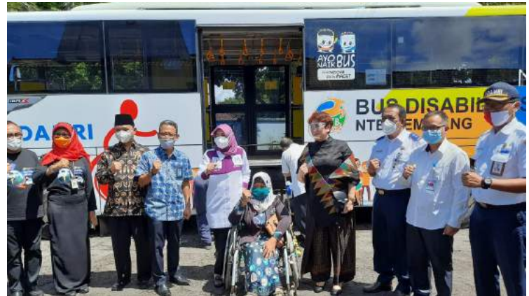
• Launching Bus Disabilitas NTB Gemilang