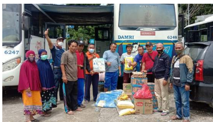
• Penyerahan bantuan logistik untuk Karyawan dan masyarakat sekitar Kantor DAMRI Cabang Mamuju