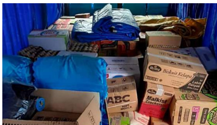
• Bantuan logistik dikirim dari Palu ke Mamuju