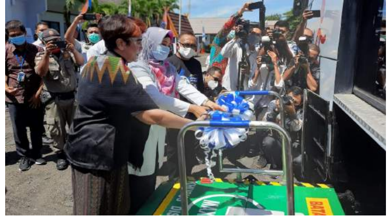
• Launching Bus Disabilitas NTB Gemilang

Bus Disabilitas NTB Gemilang DAMRI Mataram merupakan bagian kelanjutan dari inovasi dan revitalisasi angkutan umum untuk harapan seluruh masyarakat dapat nyaman dan aman bermobilitas menggunakan transportasi bus. DAMRI berkomitmen untuk senantiasa memberikan pelayanan optimal kepada pengguna jasa transportasi publik, serta berharap dapat meningkatkan kembali perekonomian dalam Program Pemulihan Ekonomi Nasional (PEN).