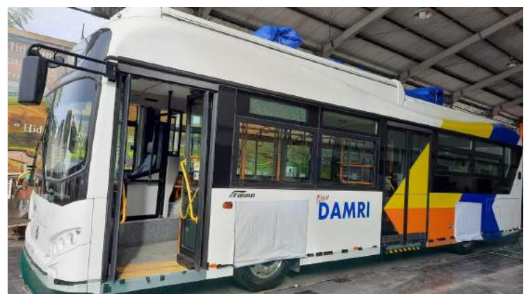
• Bus Listrik DAMRI