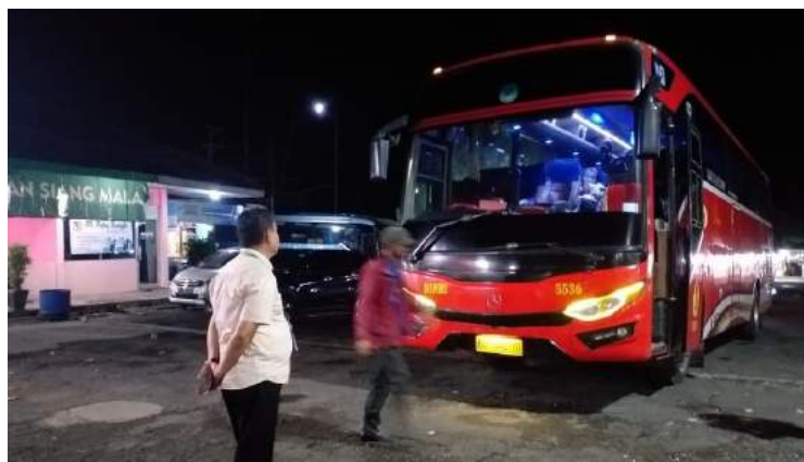
• Lokasi: Cabang Lampung