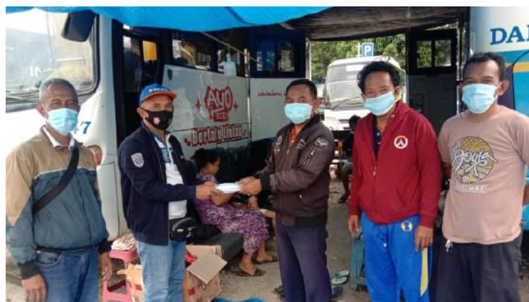
• Penyerahan bantuan dana sebesar Rp 20 juta